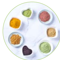
FOOD / FEED