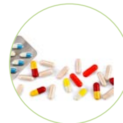
NUTRITION / SANTÉ